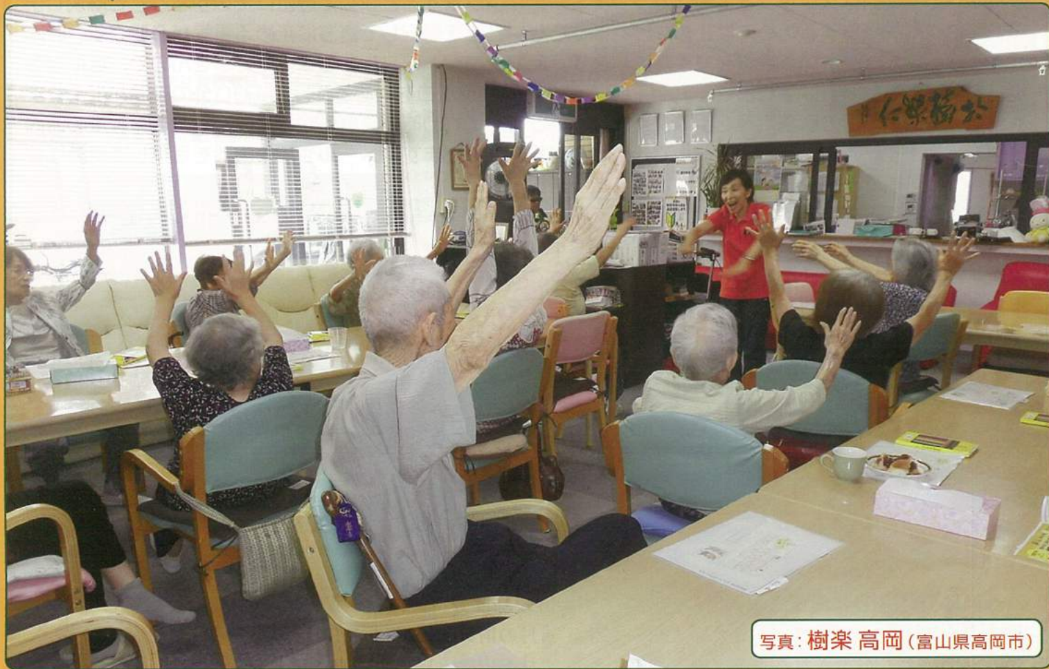
写真：樹樂 高岡(富山県高岡市)