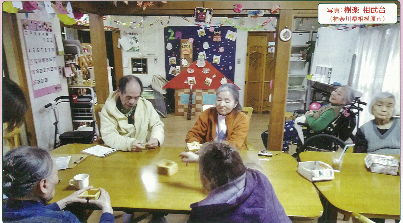
写真：樹樂 相武台 (神奈川県相模原市)