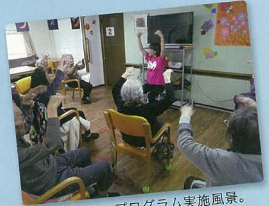
↑直営での、プログラム実施風景。テンポ良いリズムに、利用者様もつついノリノリです。

樹楽チェーンでのプログラム利用開始は、来春の3～4月頃の予定です。都度、進捗状況を皆様にご報告させていただきます。乞うご期待ください。